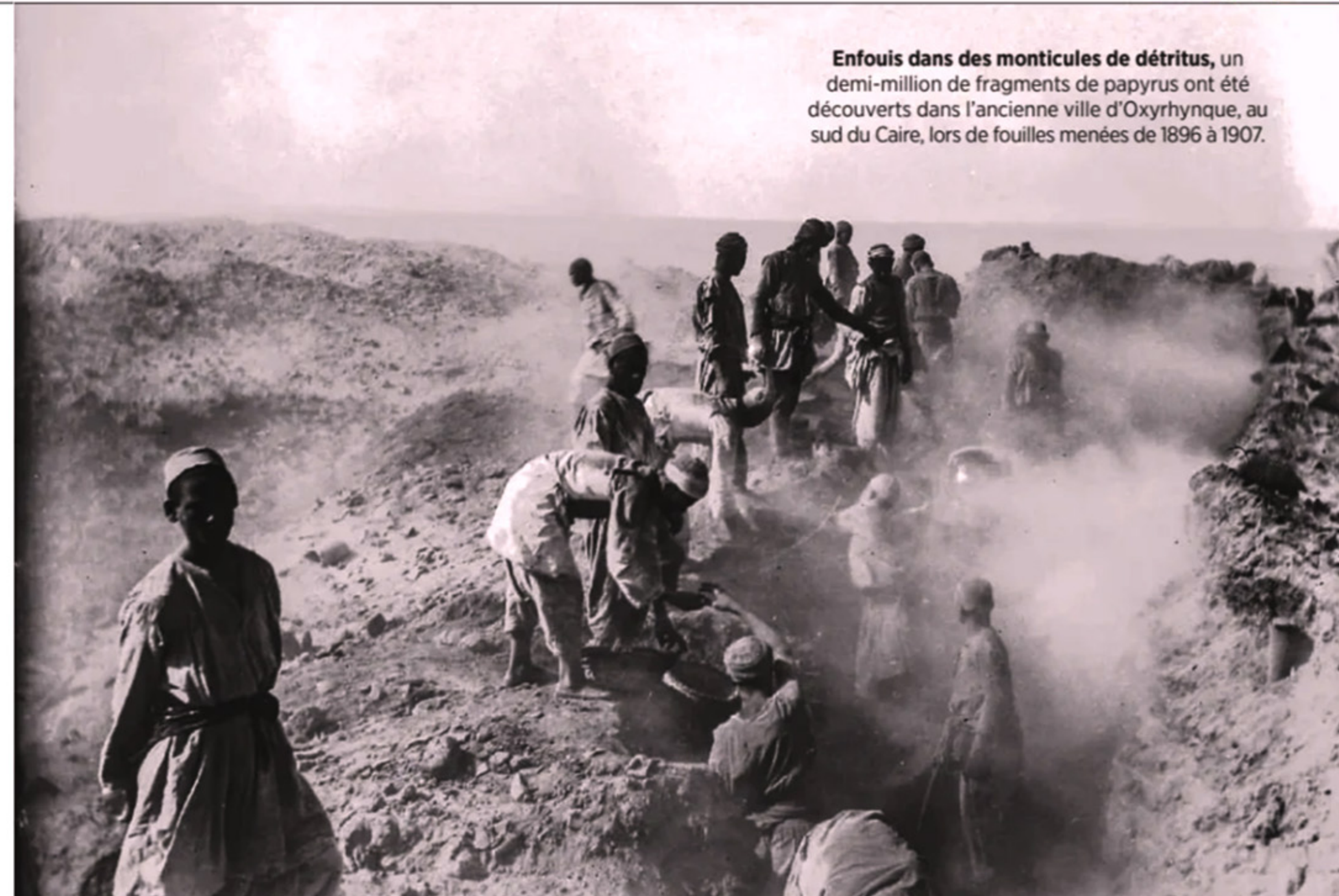
Enfouis dans des monticules de débris, un demi-million de fragments de papyrus ont été découverts dans l'ancienne ville d'Oxyrhynque, au sud du Caire, lors de fouilles menées de 1896 à 1907.