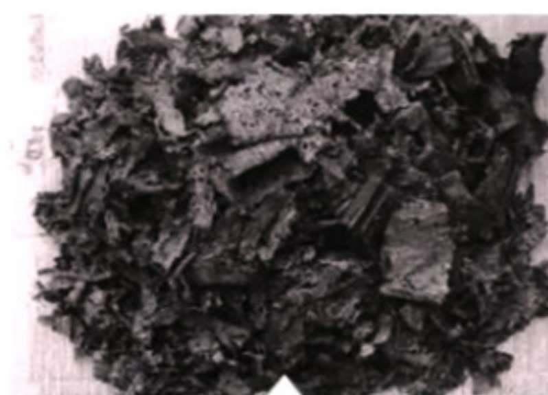
Fragments de papyrus collectés durant les fouilles du site égyptien.

En 1897, alors qu'ils fouillent un site antique égyptien considéré comme mineur — Oxyrhynque, ancienne bourgade grecque située à quelque 180 km au sud du Caire —, deux jeunes archéologues britanniques du Queen's College d'Oxford tombent sur un inestimable trésor archéologique : un amoncellement vertigineux de morceaux de papyrus entassés sur une dizaine de mètres de hauteur. Bernard Pyne Grenfell et Arthur SurrIDGE exhument plus d'un demi-million de fragments de textes rédigés principalement en grec et en latin, même si certains figurent en hiéroglyphes, en copte ou encore en hiératique. Parmi eux, des documents datés pour la plupart du