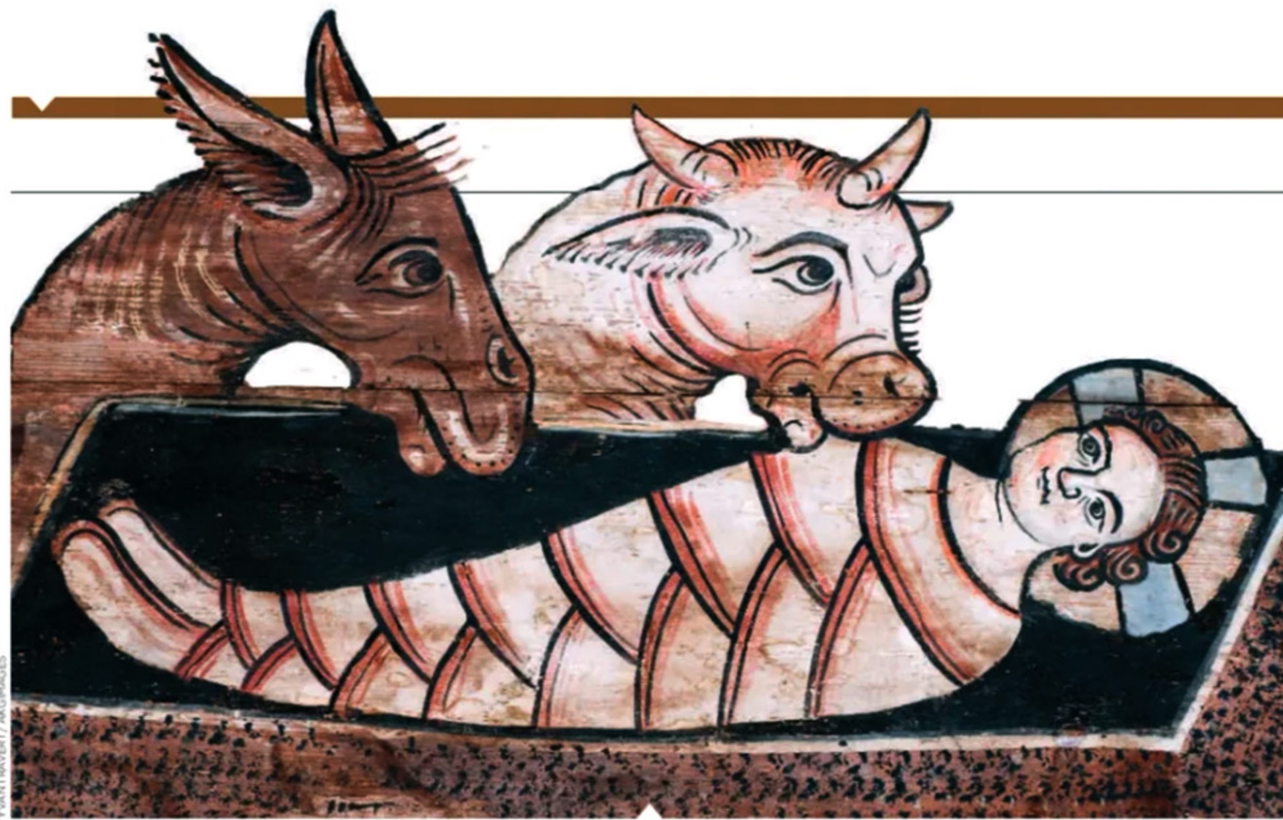
Représentation de la Nativité (détail du plafond de l'église Saint-Martin de Zillis, en Suisse, peint au XIII e siècle).