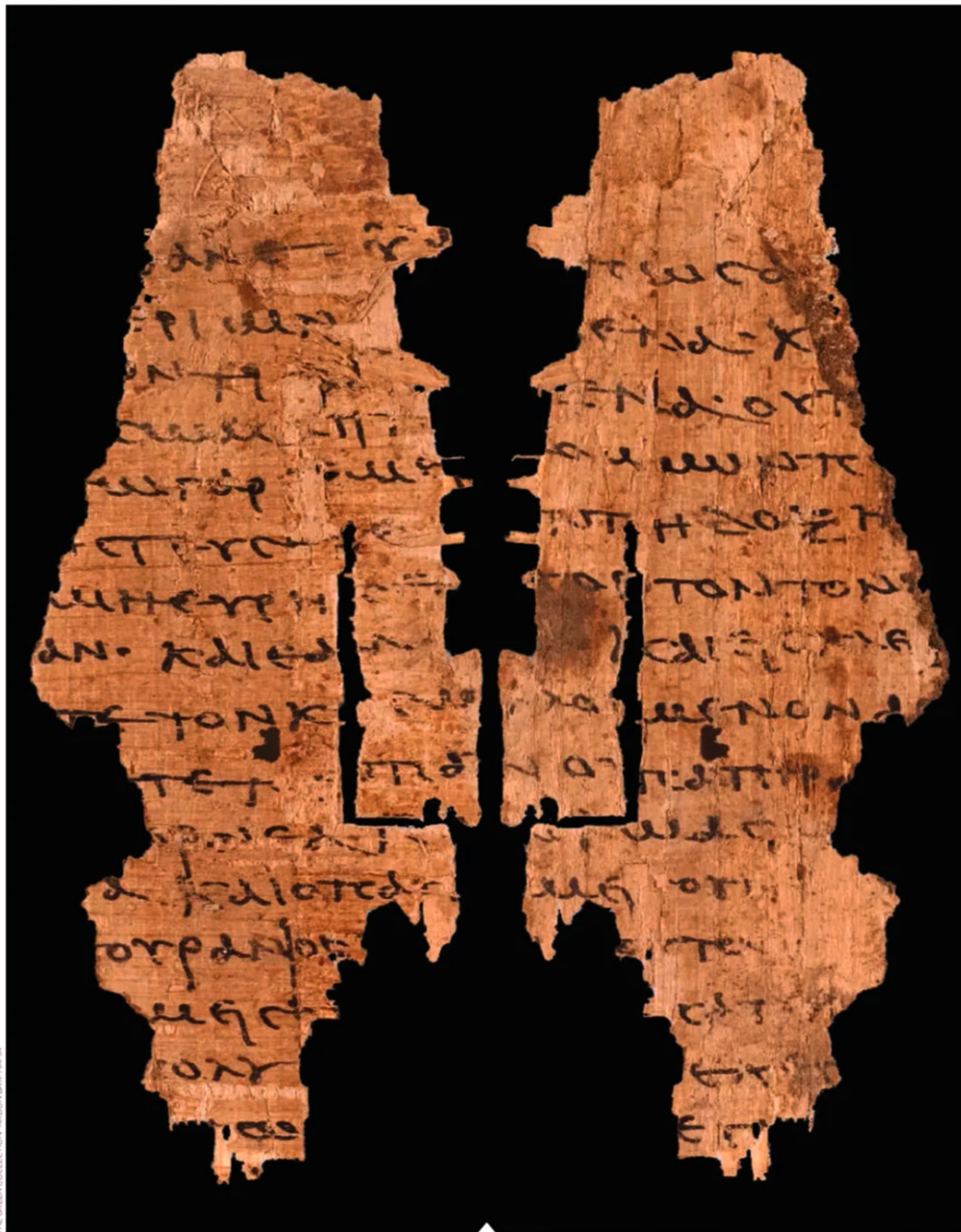
Ce fragment de quelques centimètres (vu ici recto-verso) est l'un des derniers textes décryptés parmi les centaines de milliers de papyrus trouvés sur le site égyptien d'Oxyrhynque et peu à peu analysés. Il relate en grec des épisodes de la vie du Christ.