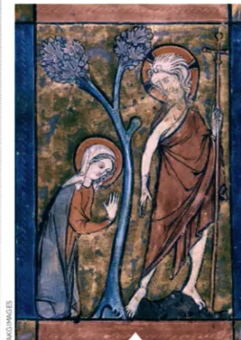
« L'apparition à Marie-Madeleine », extrait d'un livre d'heures du XIII e siècle.